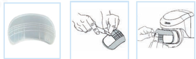
Jalousie-Klips nach belieben entfernen