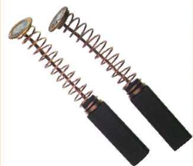
K-F-T Kabel • Feder • Teller